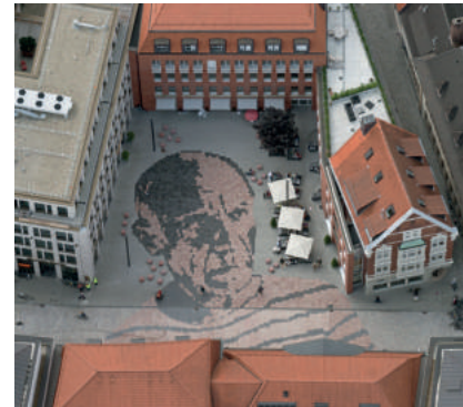
Picassoplatz, die Schirme gehören zum Caputo's.