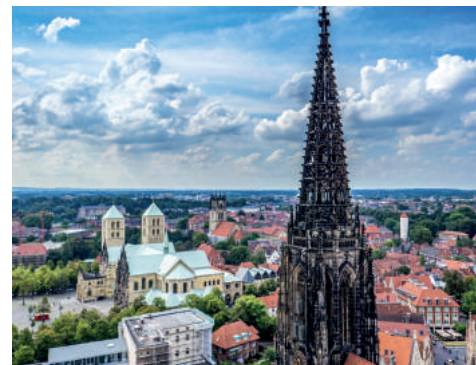
Blick von St. Lamberti auf den Dom