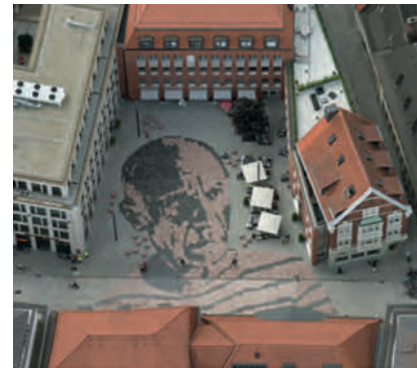
Picassoplatz, die Schirme gehören zum Caputo's.